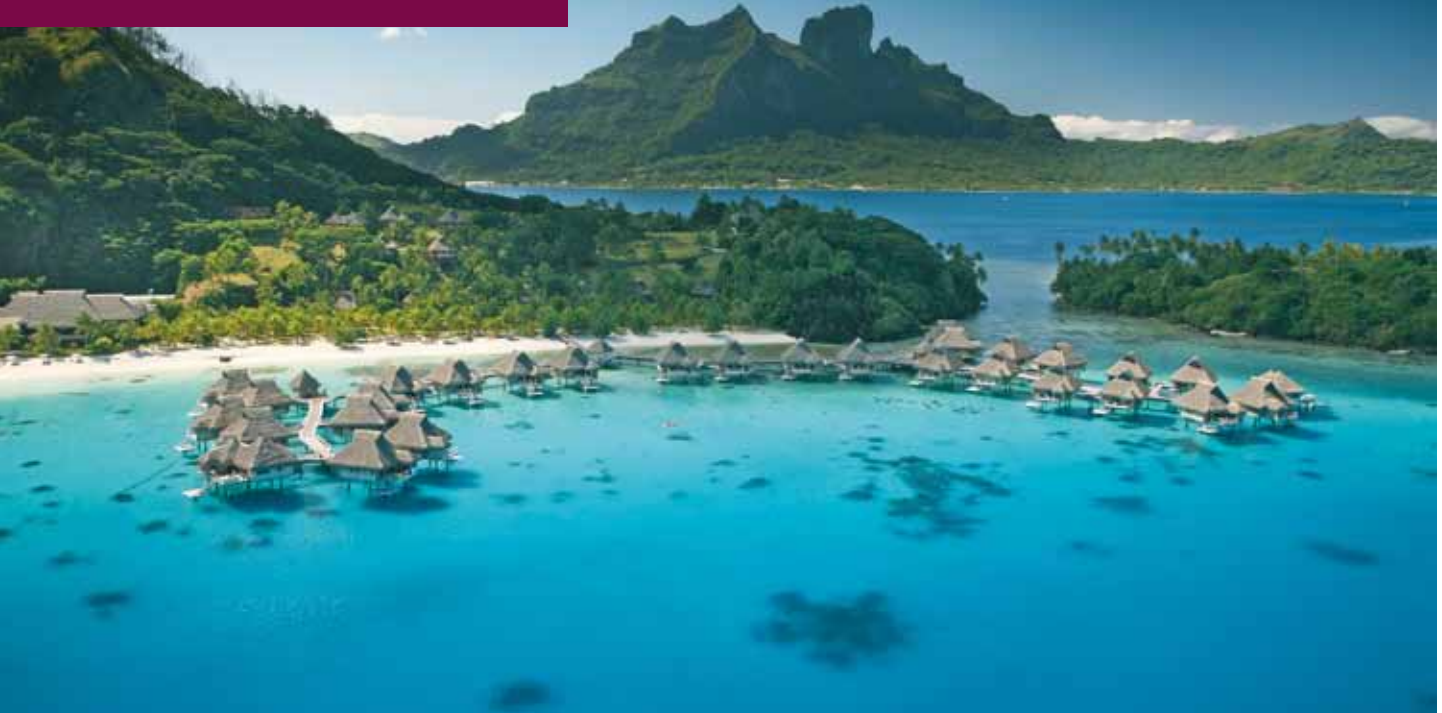
Bora Bora