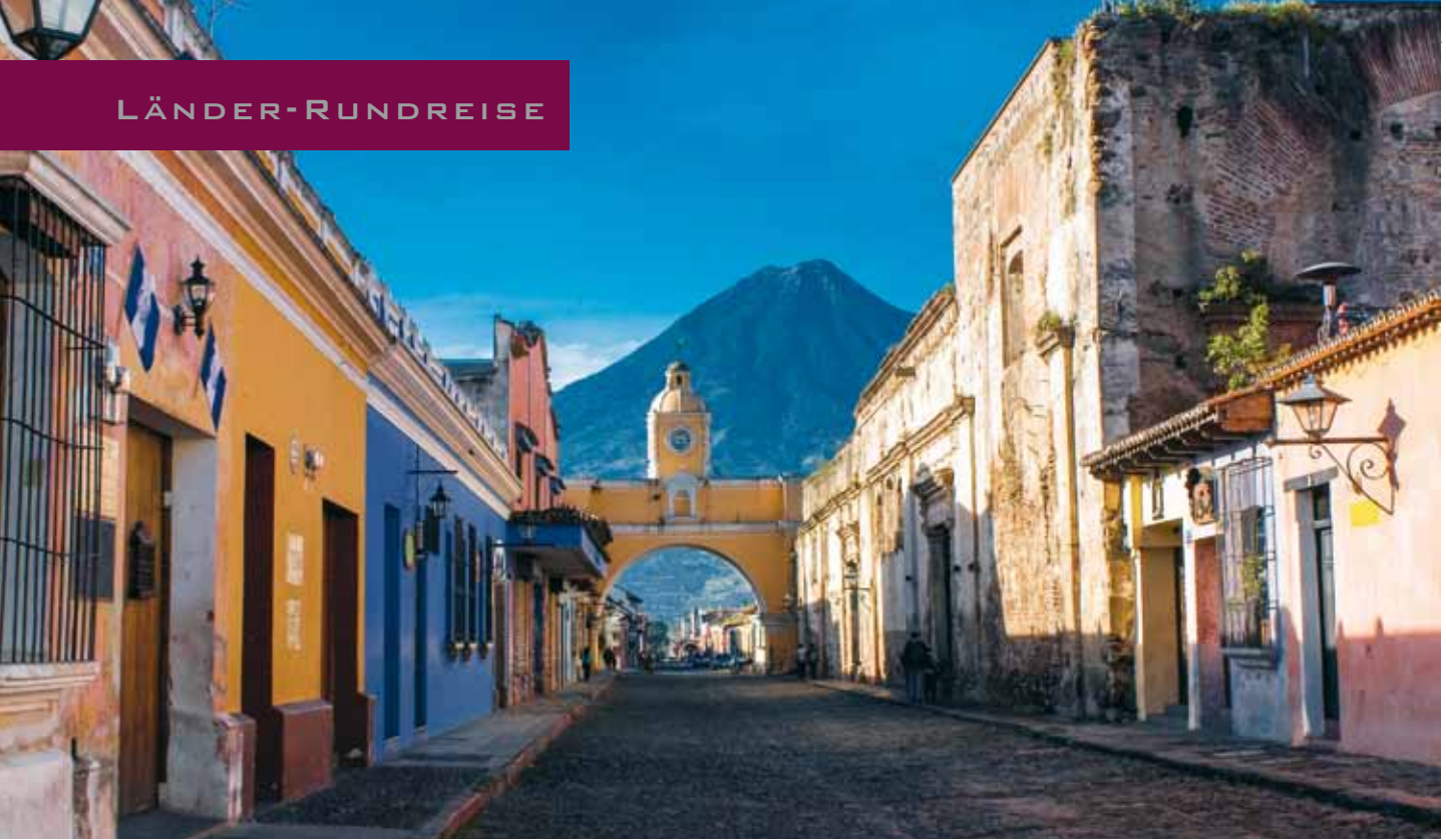
Antigua / Guatemala