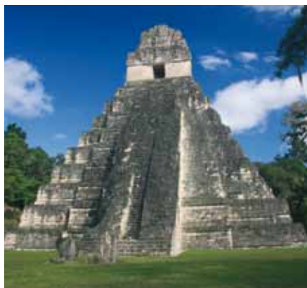
Tikal / Guatemala